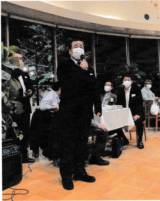
【開会挨拶(オクトーバーフェスト懇親会)】