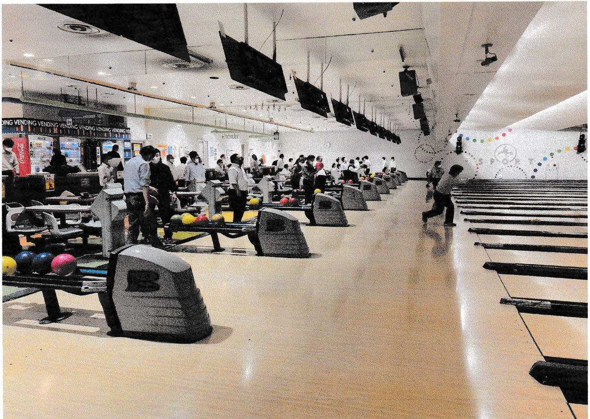
【ボウリング大会の様子】