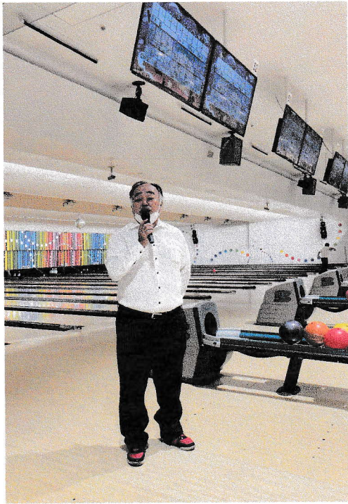
【開会挨拶（ボウリング大会）】