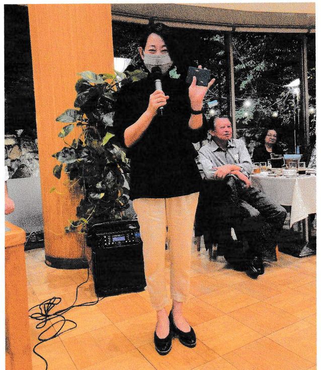
【表彰式の様子(優勝者スピーチ)】