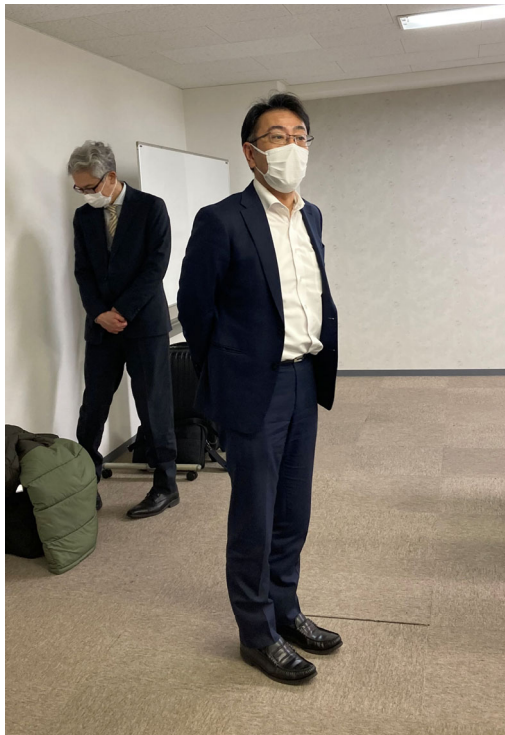
【青掛会長開会挨拶】